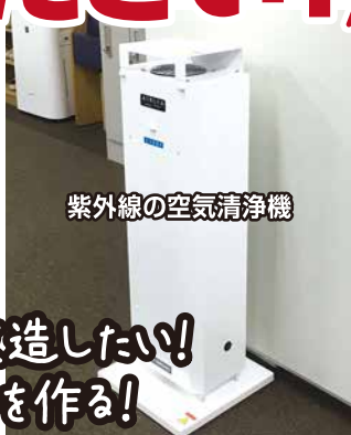
紫外線の空気清浄機

ロボットで友達と競争するのが楽しい!もっと改造したい! ギアの仕組みがよくわかった!おもしろいロボットを作る!